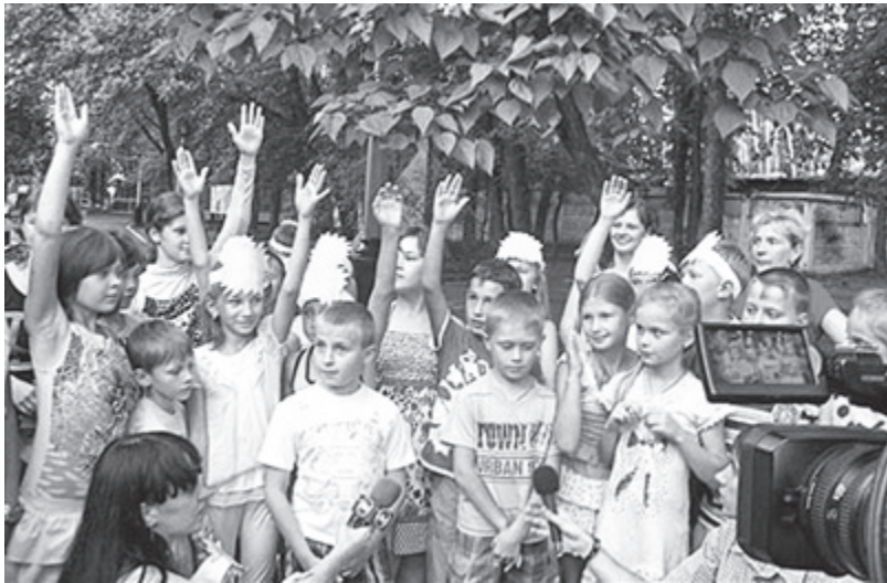
На балансе ПАО «ДТЭК Павлоградуголь» находится 3 детских оздоровительных лагеря: «Павлогралец», им. С. Маркова и «Пролиско», в которых отдыхают и оздоравливаются дети шахтёров из городов Западного Донбасса Павлоград, Терновка и Першотравенск