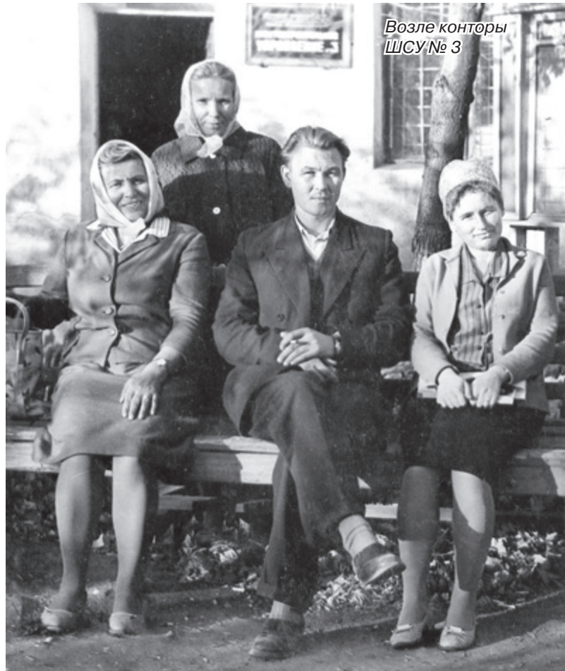
Возле конторы ШСУ № 3