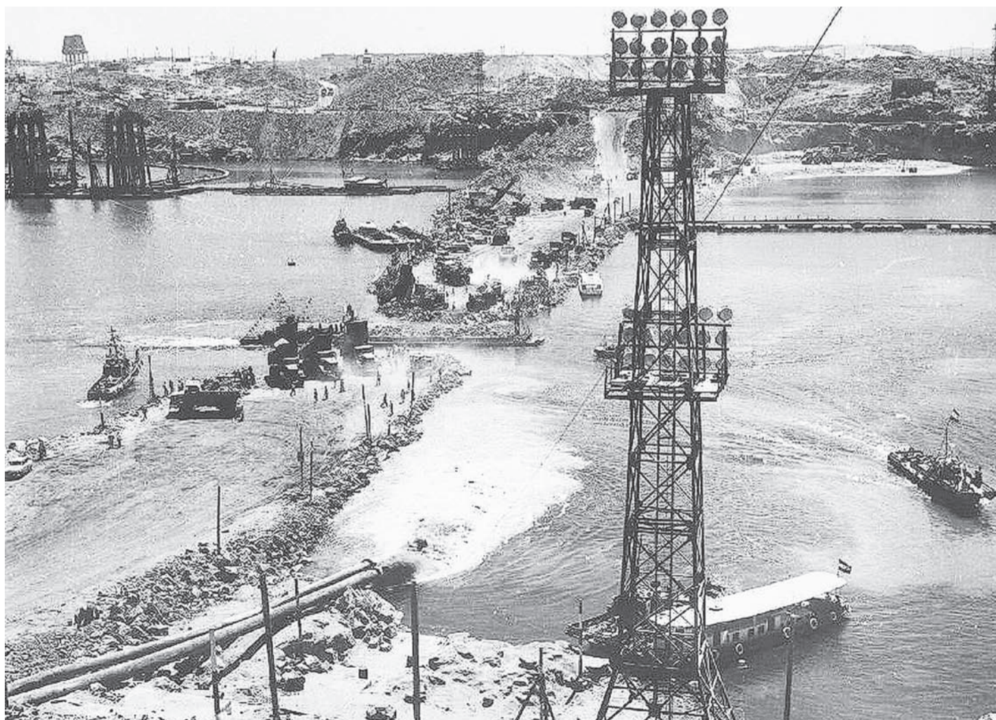
Стройка 20-го века – Асуанская плотина