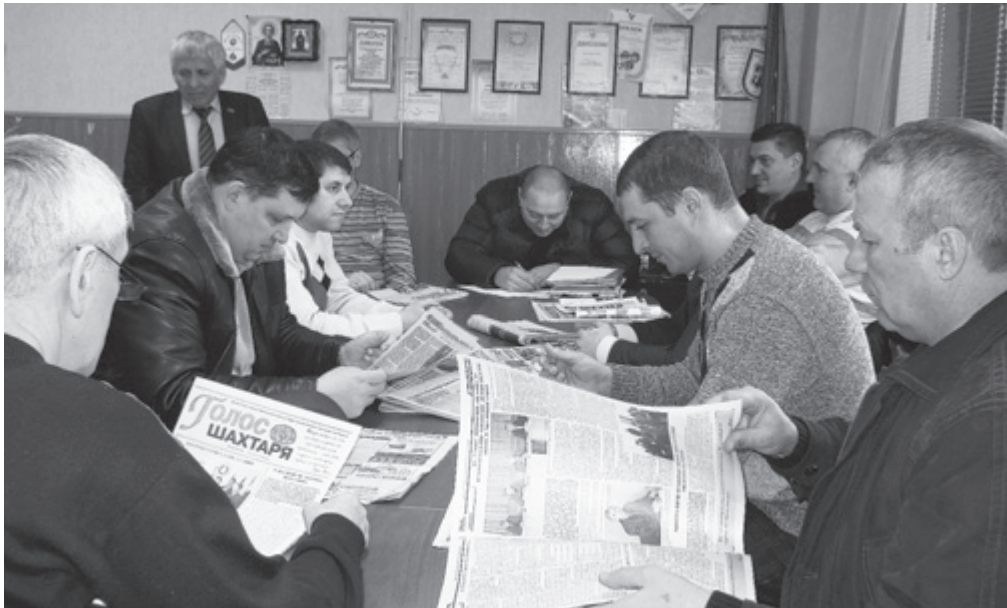
Через несколько минут начнется очередное заседание профкома

На шахте «Днепровская» члены профсоюзного комитета проголосовали за проведение ежемесячного анализа причин, из-за которых шахтерские трудовые коллективы не справляются с выполнением доведенных до них производственных заданий. Эти действия необходимы для того, чтобы работники не страдали из-за отсутствия премий по независящим от них причинам.