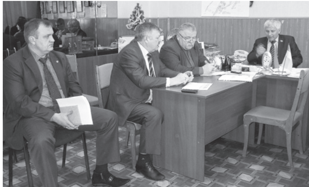
Социальный диалог с администрацией

О том, сколько денег было недополучено трудящимися шахтоуправления по